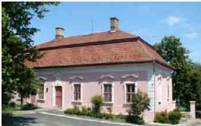
Sátoraljaújhely, Széchenyi István tér 10.